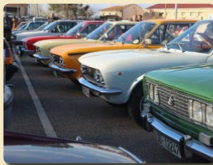
Concentraciones de clubes de aficionados