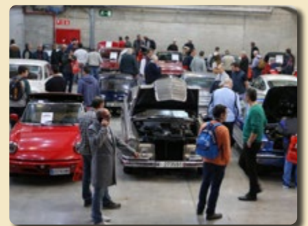
Compra-venta de vehículos clásicos entre particulares