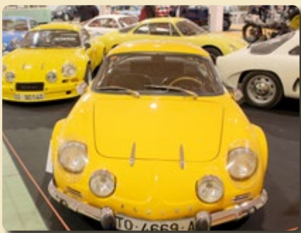
Exposiciones monográficas de automóviles y

AutoJumble Madrid se enriquecerá con un programa de actividades participativas y expositivas dirigidas a favorecer la proyección de la historia del motor y a crear afición.